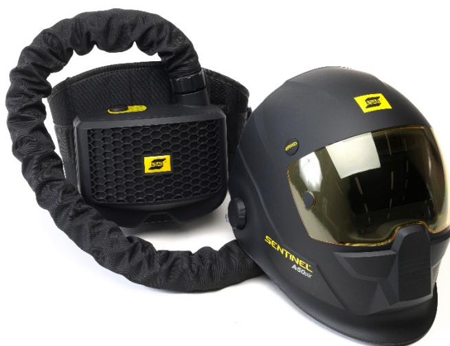
SENTINEL A50 Air z urządzeniem ESAB PAPP