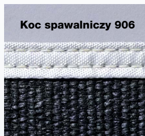
Koc spawalniczy 906

Elastyczny koc spawalniczy Temperatura maksymalna = 550°C, masa = 600 g, kolor = ciemny brąz.