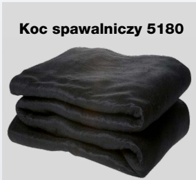
Koc spawalniczy 5180

Koc z włókna szklanego Maksymalna temperatura = 550°C, masa = 460g, kolor = szary.