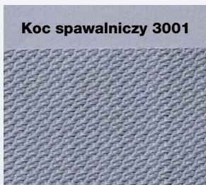
Koc spawalniczy 3001

Koc z włókna szklanego Temp. maksymalna = 750°C, masa = 1020 g, kolor = szary.