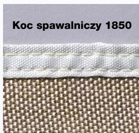
Koc spawalniczy 1850

Dostępne są trzy kolory kurtyń. Każda z nich oferowana jest w wersji standardowej lub paskowej. Kurtyny mają wykończenie szerokimi 5 cm mankietami z otworami na kółka mocujące z rozstawem co 20 cm na szerokości po jednej stronie. Zapinane od prawej i lewej strony specjalnym systemem na zatrzaski. Wszystkie kurtyny posiadają certyfikaty zgodności z normą EN 1598.